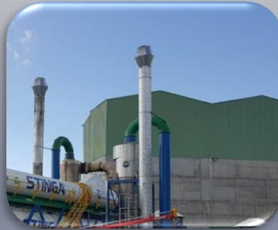
Baca çıkış sıcaklığı 72 °C Doğalgaz emisyon değerlerinin altında baca gazı ölçümlerimiz mevcuttur