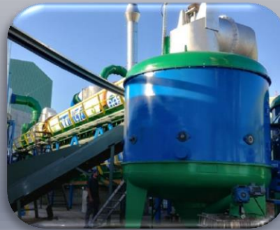
4 D Gasbuster Burnin By Gasification ( gaz haline getirme ile yakabilen) DRY Sıcak Hava Reaktörü

%80 nem içeren yakılması ve bertarafı mümkün olmayan arıtma çamuru Stinga Teknolojisi ile kurutulduğunda %2 nem oranına düşürülerek kokusuz ve zararsız çevreci kurutulmuş katı yakıtı dönüşmüştür. Bununla birlikte kurutulan çamur yakılarak %100 ü bertaraf edilmektedir. Katı yakıtın çıkış sıcaklığı ~ 90°C ~ %80 nemden %2 nem oranına indirilerek ~ 3500 kgcall elde edilen katı yakıtın ~ %10 ile prosesin ihtiyacı olan ısı enerjisini sistem kendi içinde sağlamaktadır. ( yukarıda verilen veriler +/- %15 olarak hesaplanacaktır)