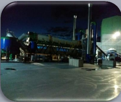
Stinga Teknolojisi Arıtma Çamuru Kurutma –Yakma –Bertaraf Tesisi