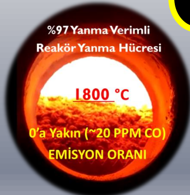
%97 Yanma Verimli Reaktör Yanma Hücresi Sıcaklık 1800 °C