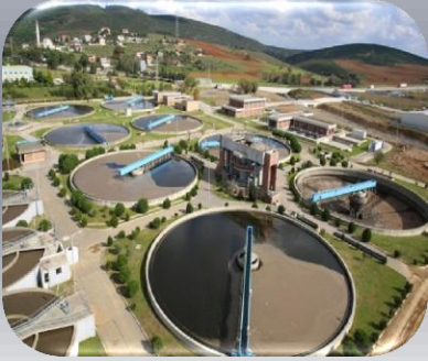
Arıtma Çamuru Tesisi