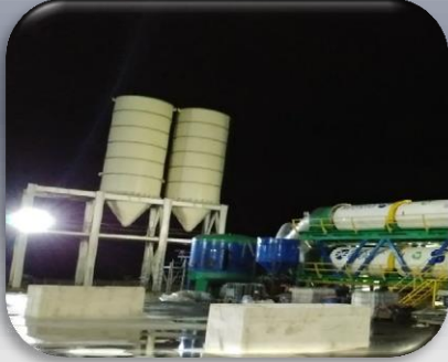
150 ton kapasiteli kurutulmuş arıtma çamuru stok siloları Toplam 300 ton