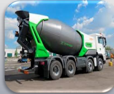
Arıtma Çamuru Taşıma Aracı