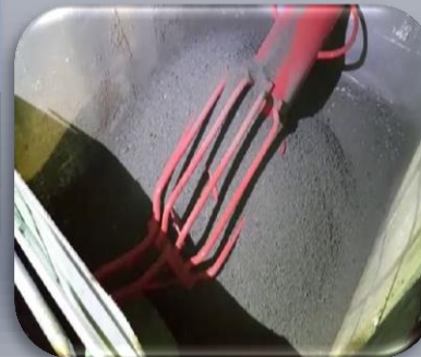
%2 Nem 3500 kcal Kurutulmuş Arıtma Çamuru

Stinga Baca Ünitesi ile çevreci olarak bilinen Doğalgaz emisyon değerlerini karşılaştırdığımızda Stinga Teknolojisi emisyon değerleri daha da aşağıda olduğu laboratuvar analiz sonuçlarında kanıtlanmıştır. Ortama çevre ve şehircilik bakanlığının belirlemiş olduğu katı yakıt sınır değerlerinin alt seviyesinde emisyon ve partikül verilmektedir.