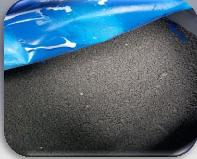
Stinga Teknolojimiz ile Kurutularak %2 Nemli ~ 3500 kgcall değerinde kurutulmuş arıtma çamuru

~ %80 nemden %2 neme indirilmiş ~ 3500 kgcall arıtma çamurundan elde edilen katı yakıtın 150 ton kapasiteli silolara beslenmesi sağlanacaktır.