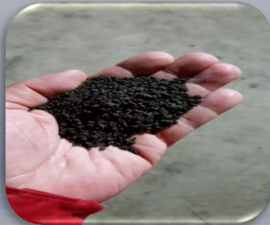
%2 Nem 3500 kcal Kurutulmuş arıtma çamuru