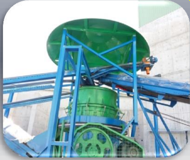
%80 nemli Arıtma Çamuru Paçallama Mixeri