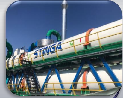
Stinga Dry Kurutma

15 ton /saat kurutma ünitesine beslenen ~ %80 nemli ~ 400 kcal kalorifik değere sahip arıtma çamuru 12 dakika sonra %2 neme indirilerek ~ 3500 kcal kalorifik değere ulaşmaktadır ve ~ 3000 kg / saat kurutulmuş katı yakıt elde edilmiştir.