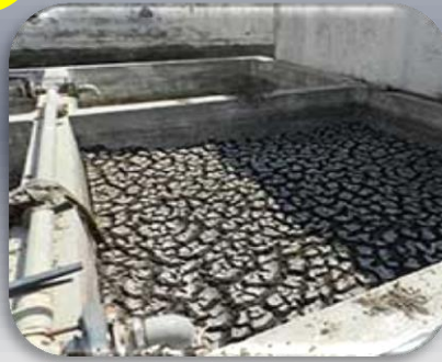
%80 Nemli Arıtma Çamuru

4 ayrı kalorifik değere sahip olan ~ %80 nemli arıtma çamurunun mix edilmesinden sonra 15 / ton saat kapasiteli kurutma fırınına taşıyıcı bantlar ile aktarımı sağlanmaktadır.